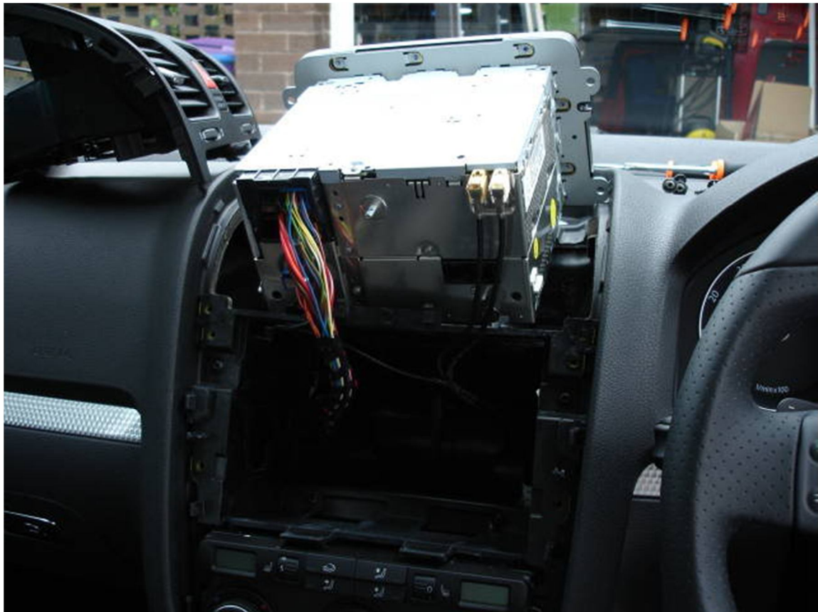
Reageren Reageren met quote